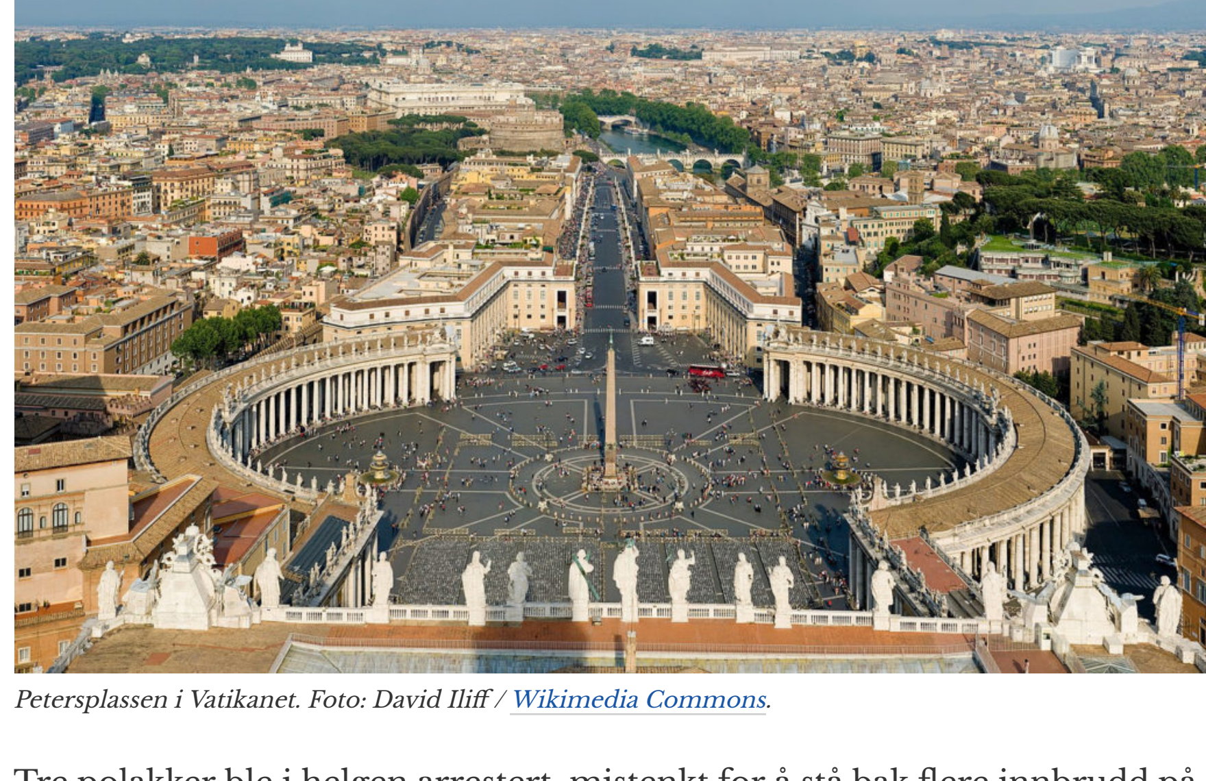
Petersplassen i Vatikanet.

Av: Karine Haaland 14. oktober 2018, 19:35