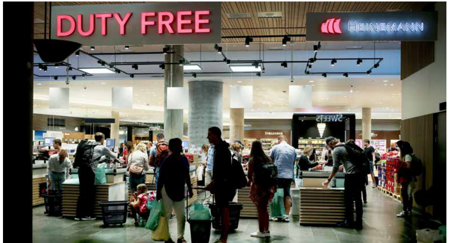
Fersk prissjekk viser at produktene på taxfreebutikkene er noe høyere enn i nettbutikkene.

ter er sjekket i taxfreebutikken, mens mobilhøytalere, hodetelefoner og solbriller er prissjekket mot butikkene som ligger i utenlandsterminalen rett utenfor taxfreebutikken.