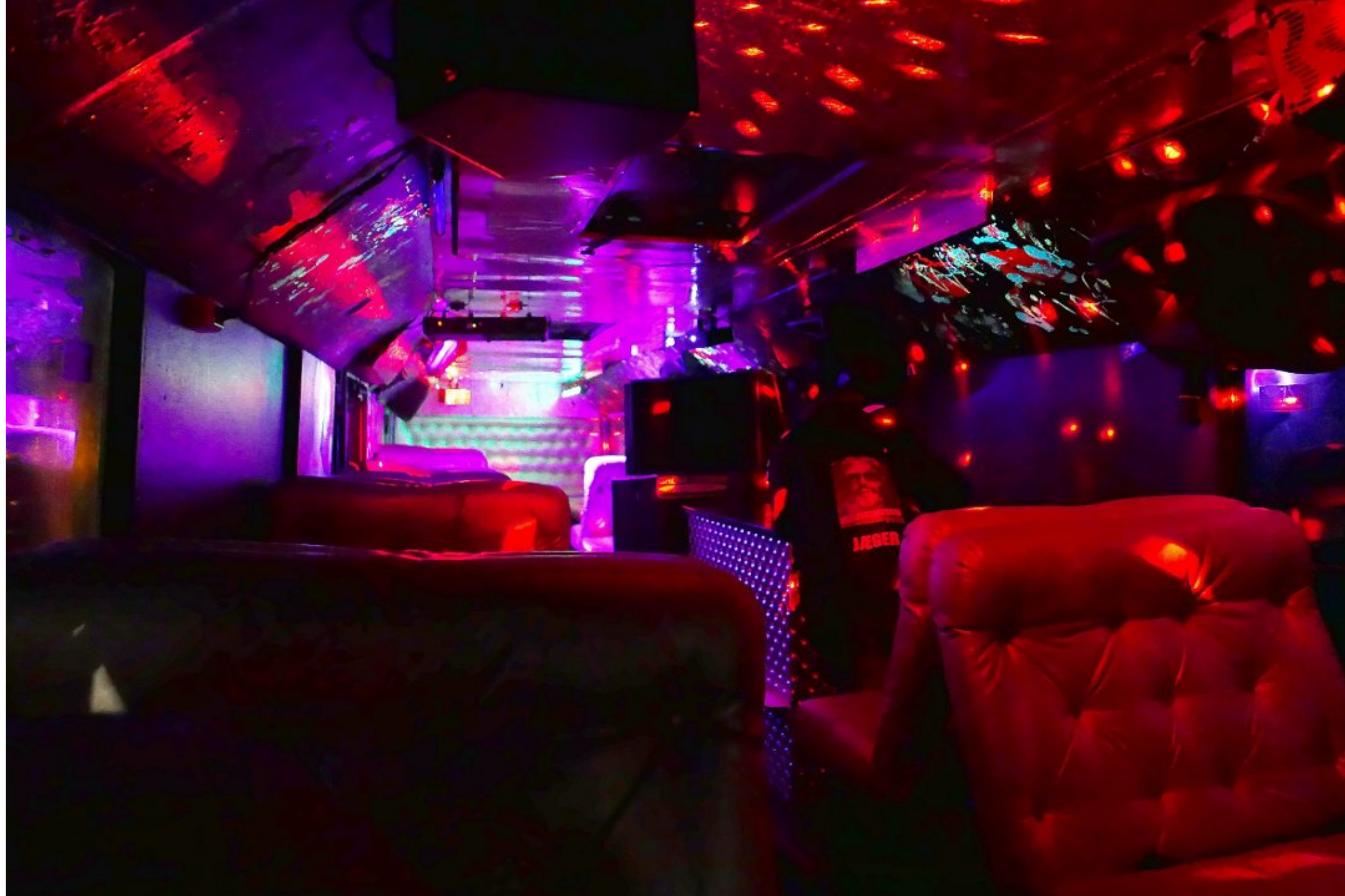
RUSSEBUSS: – Tenk deg det motsatte, hvis det igjen skulle skje en bussulykke. Da ville du sikkert stilt spørsmål om hvorfor ikke politiet gjør nok for å forebygge, skriver innsenderen.