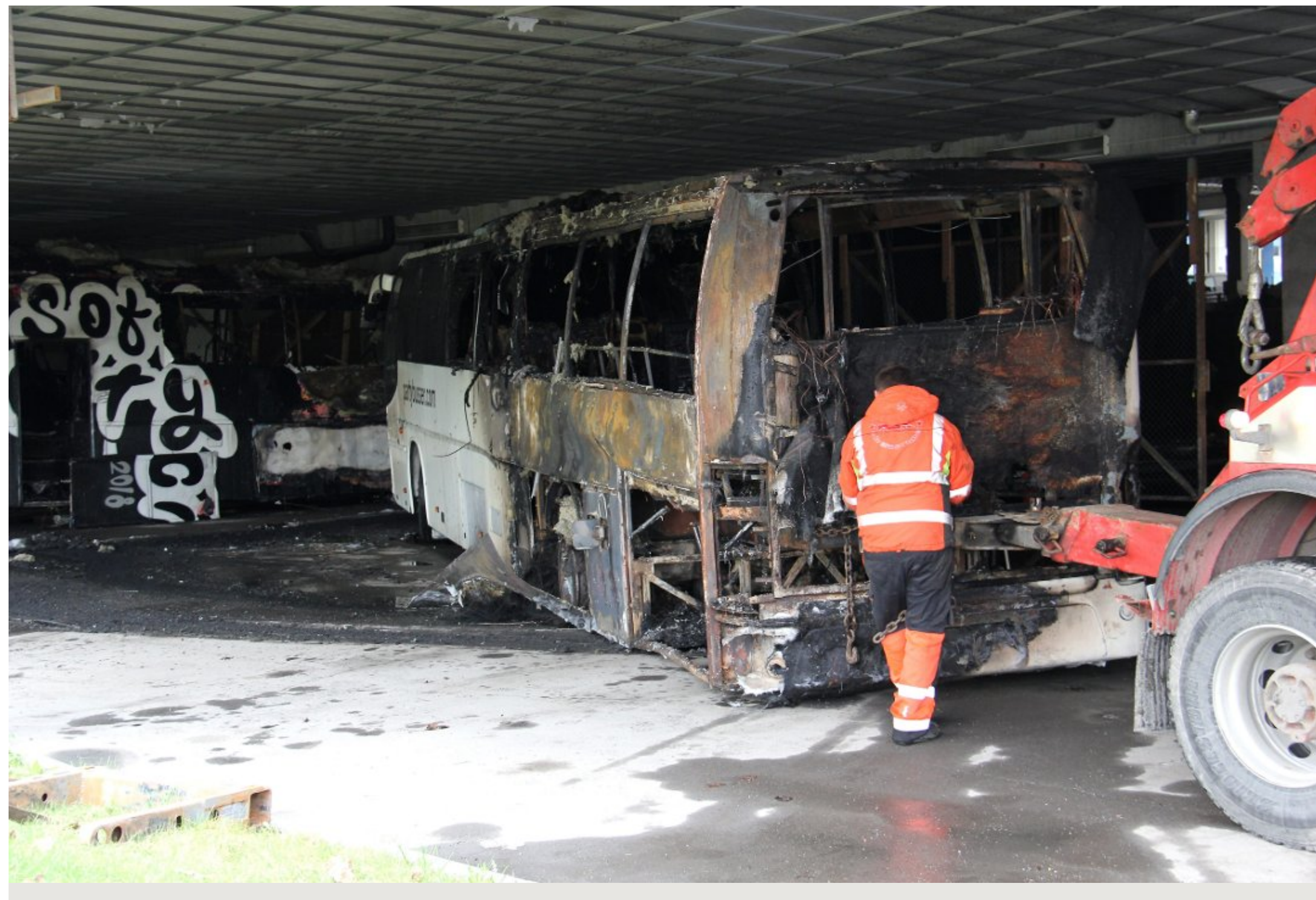
UTBRENT: To busser ble totalskadd i en brann på Fornebu denne uken. Nå er saken henlagt.