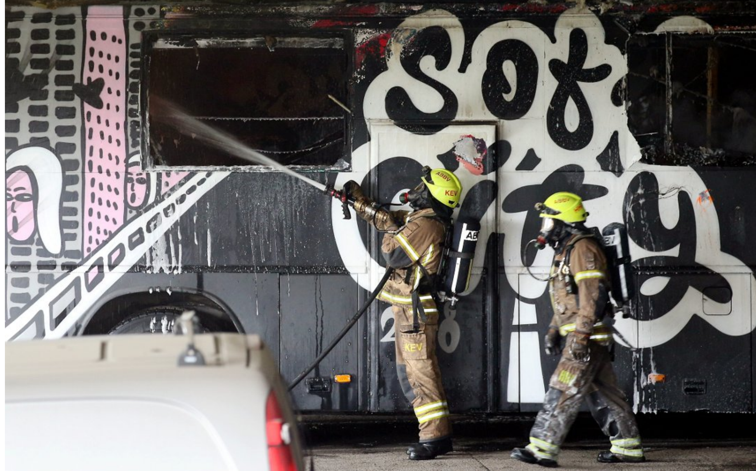
ØDELAGT: Bussen Soft City 2018 tilhørte en gjeng med jenter fra Nesodden. Bussen deres ble totalskadd i brannen og må kondemneres.