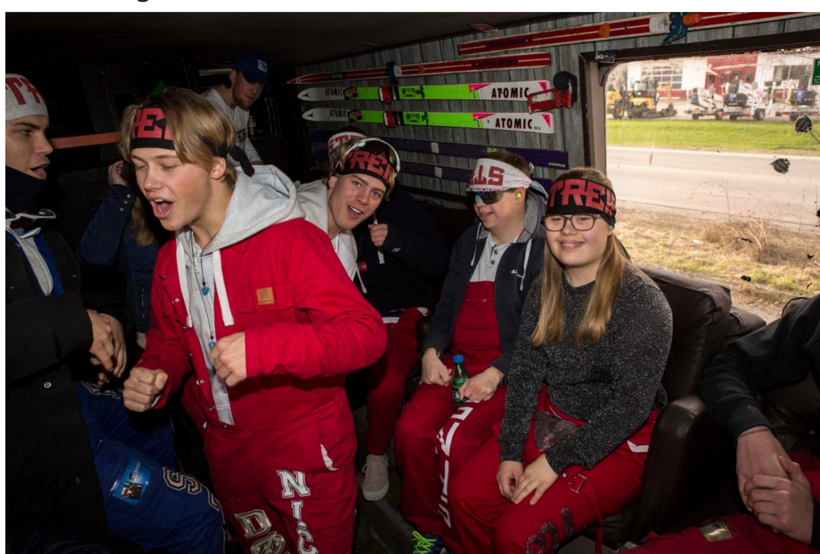
DANS: Det ble som seg hør og bør både høy musikk, dans og god stemning inne i bussen.

Russebusen Streif består av gutter fra Nadderud, Dønski og Stabekk videregående skole. De nølte ikke med å tilby rulling.