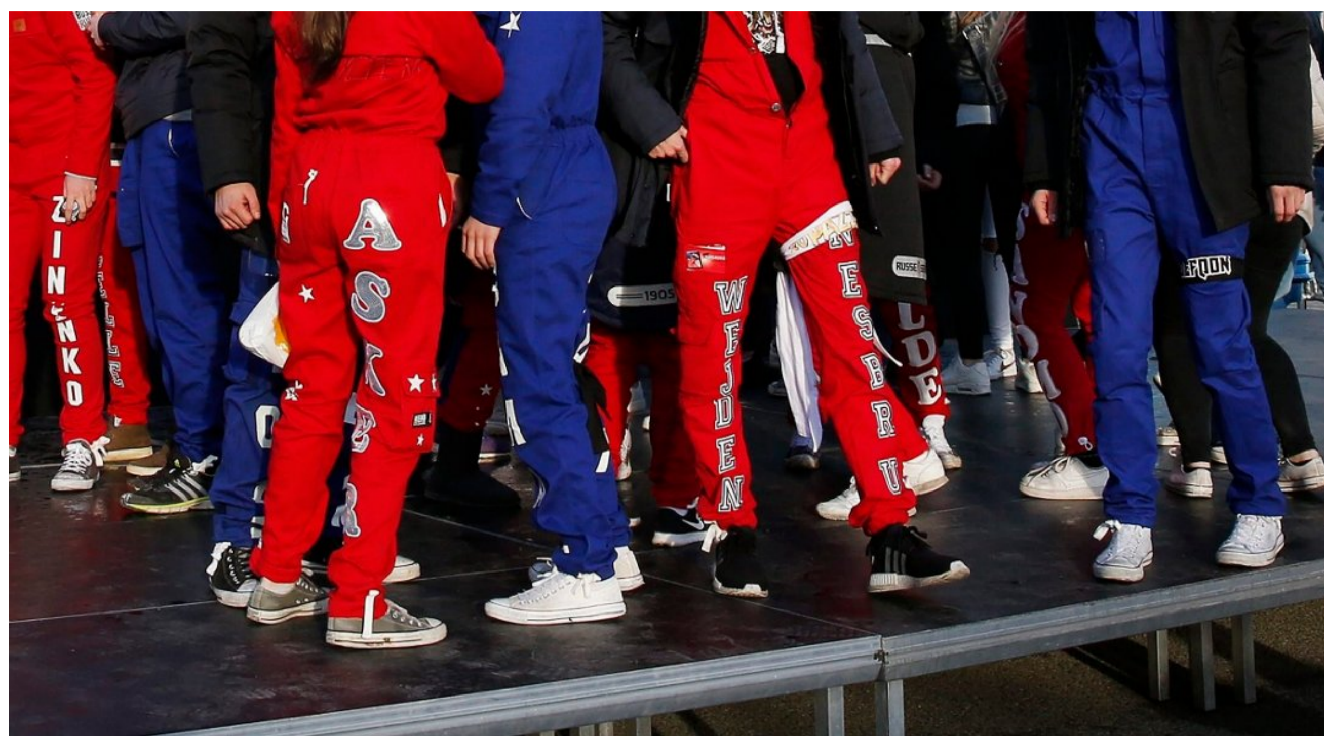
STØY: Russen sørget for at politiet fikk hendene fulle natt til lørdag. Bildet er tatt ved en tidligere anledning.