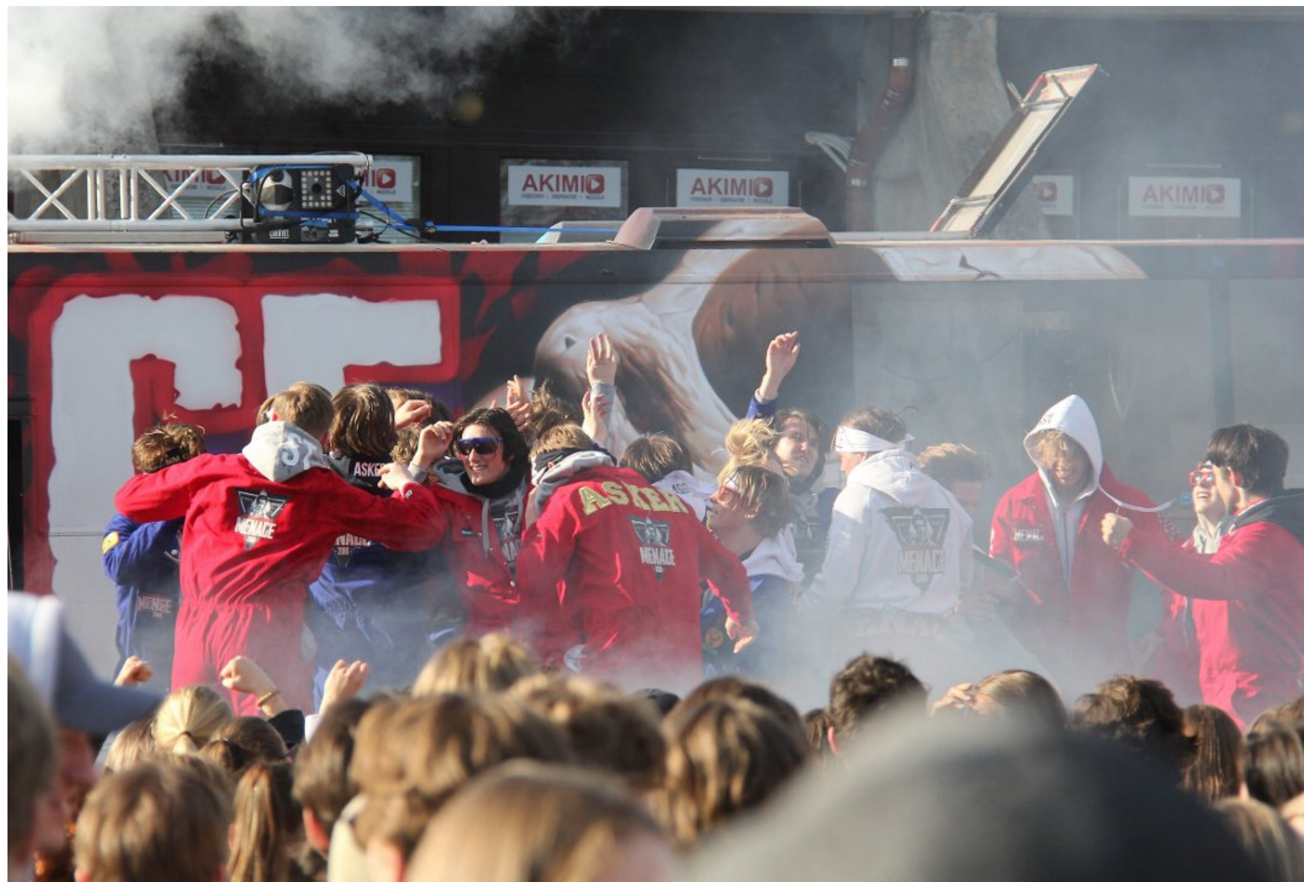
VILLE: Mye trøkk da disse guttene klinte til i takt.

LES OGSÅ: Samlet inn 872.000 til kreftkampen