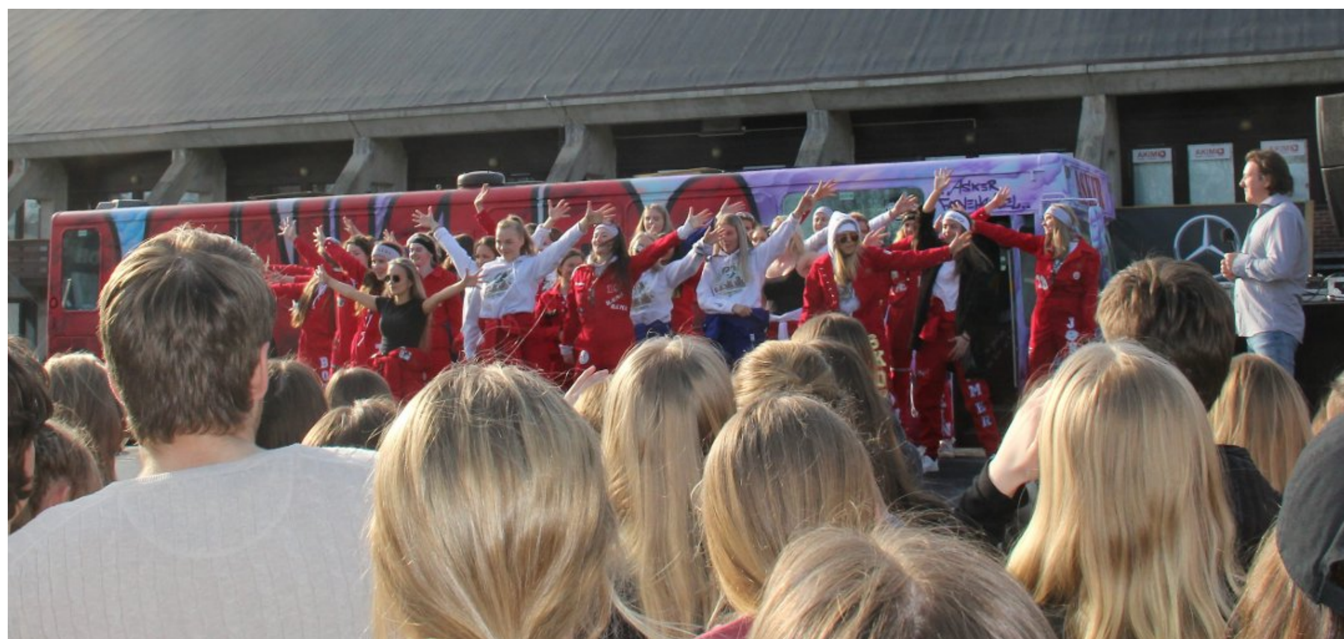
GODE: Bænkens slo til med skuespilleri, miming og taktfull dans.