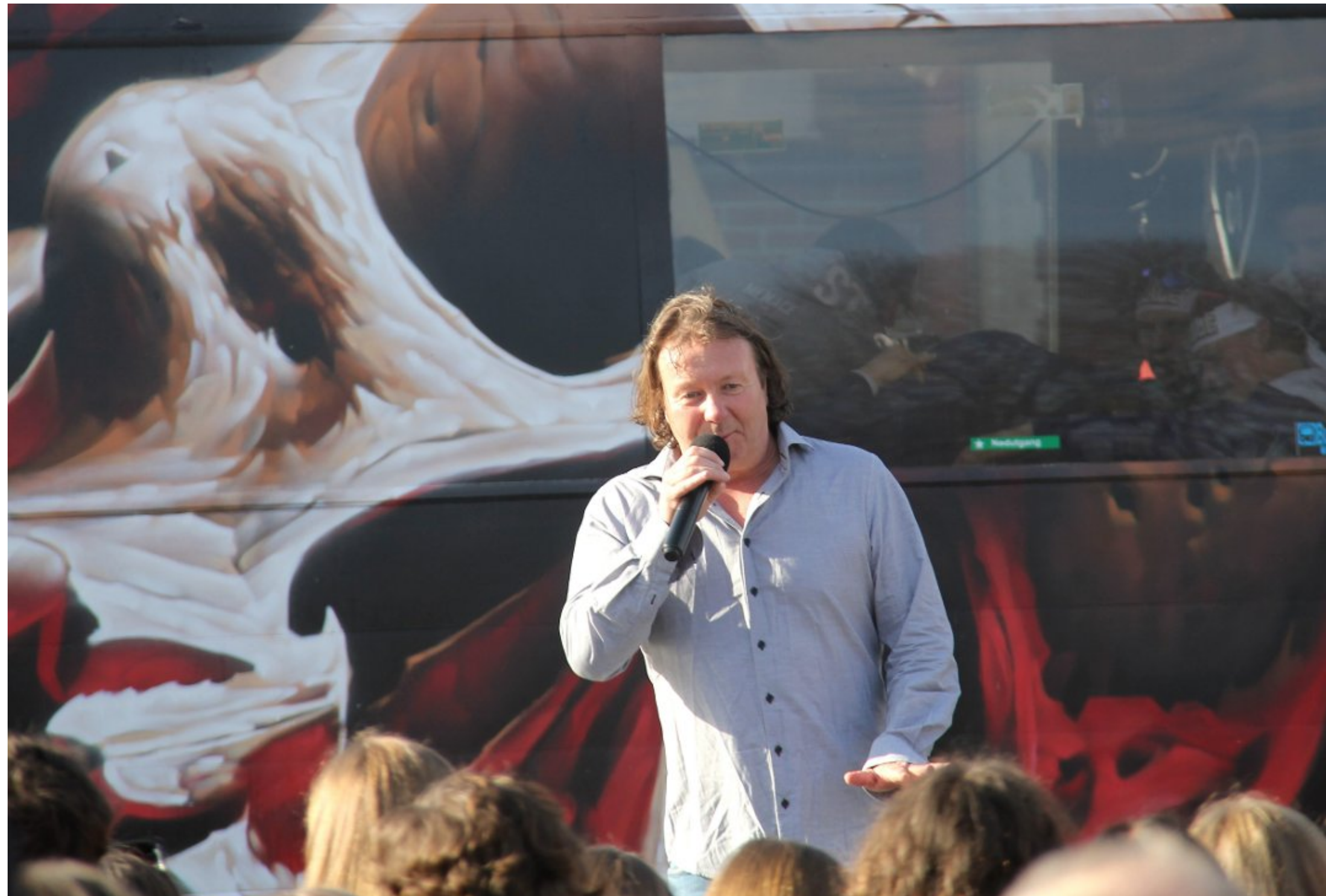
SJEF: Charter-Svein fra Heggedal likte seg med mye fart i mikrofonen.