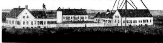
Mottagerstationen paa Nerland, som vil bli nedlagt.

Under prøvedriften har man oppnaad forbindelse med en hel